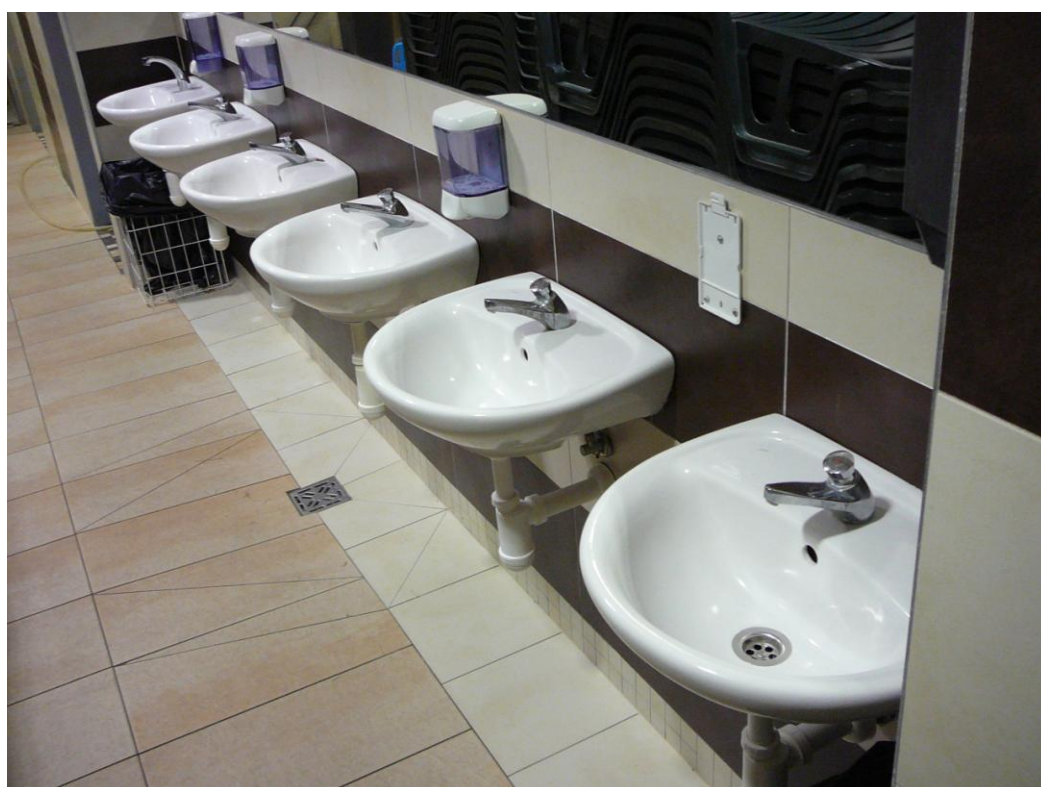
Obrázek 7 - prostory umyvadel