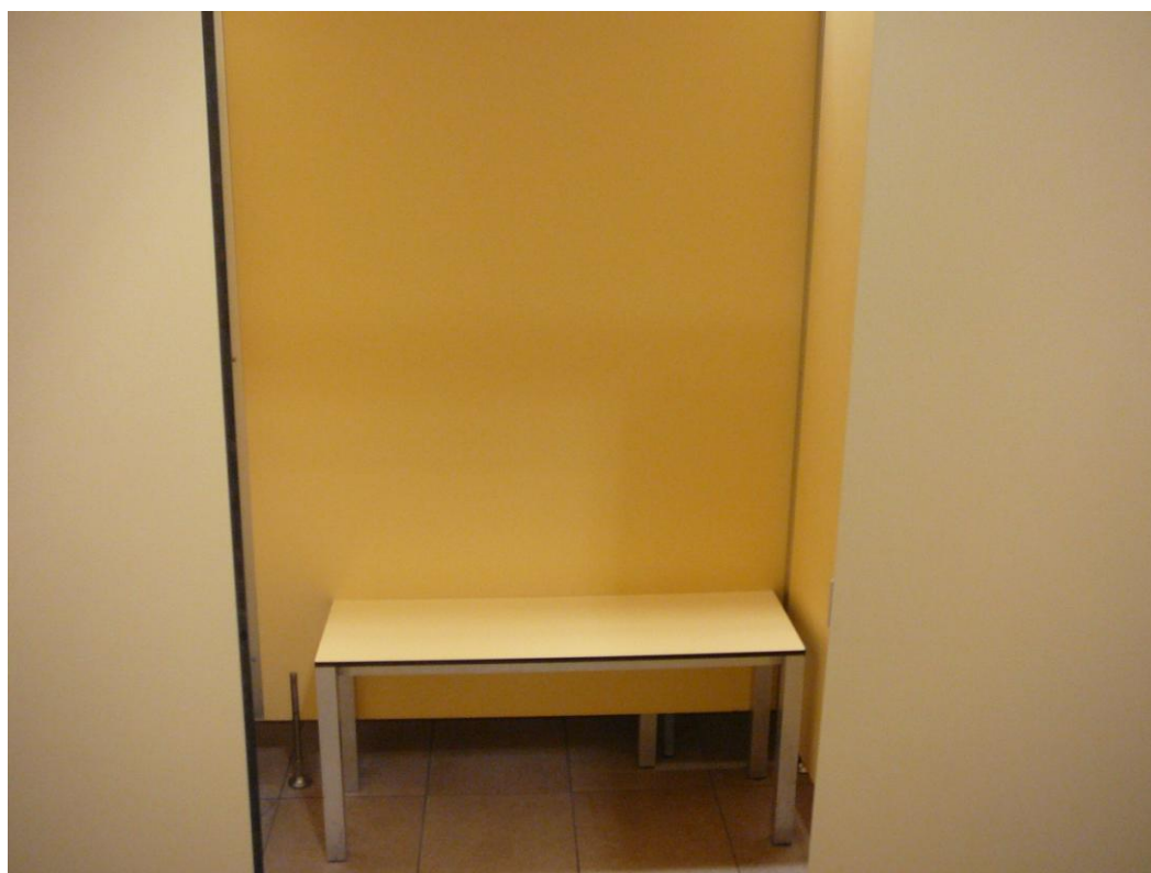
Obrázek 3 - převlékácká kabinka a lavička