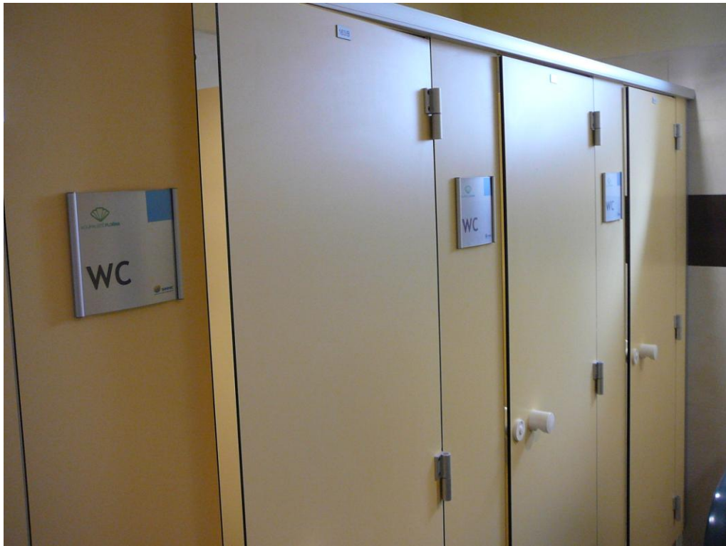
Obrázek 5 - záchodové kabinky