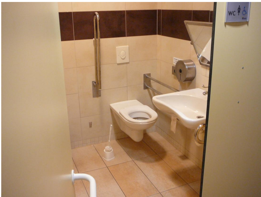
Obrázek 2 - toalety pro invalidy