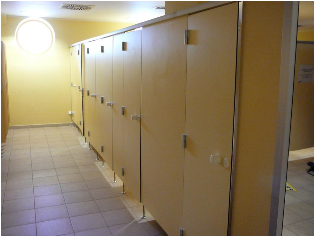
Obrázek 4 - převlékácké kabinky v letních šatnách