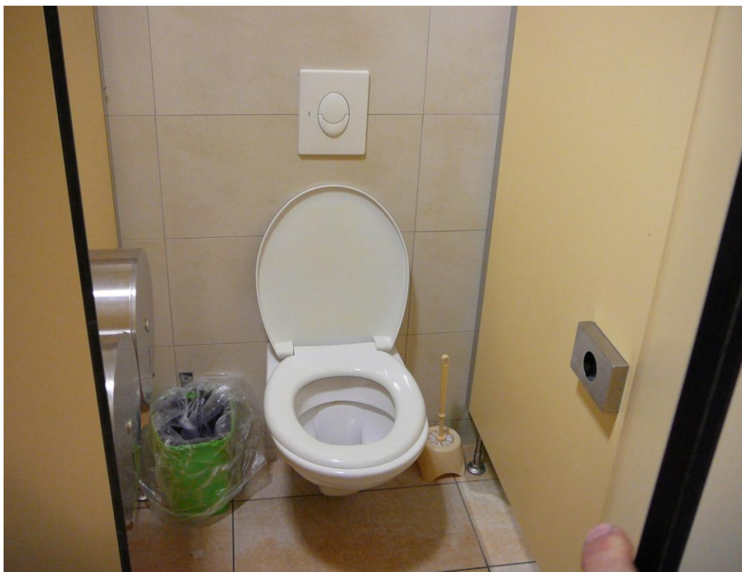
Obrázek 6 - toaletní mísy v kabinkách a vybavení